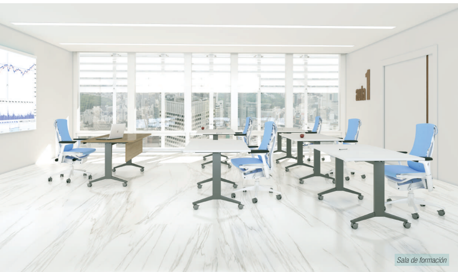
Sala de formación

Disponemos de una gran variedad de colores estandars y posibilidad de consultar más colores en ambito de especiales.