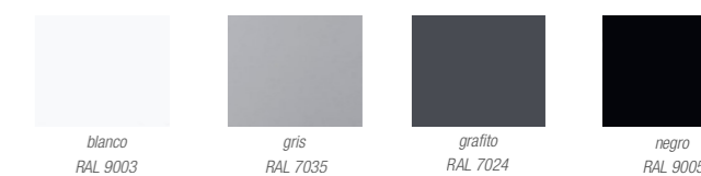
blanco RAL 9003

* para otros colores consultar acero laminado en frío 2 mm