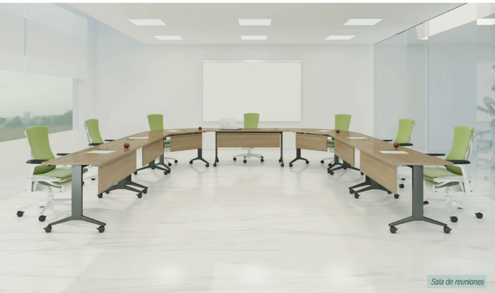
Sala de reuniones